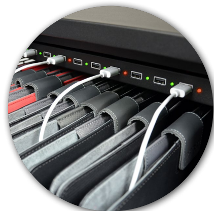
Charge progress LED indicator Indicateur LED de progression de chargement