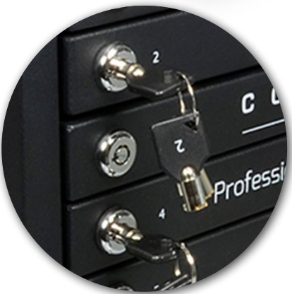
Individual lockable doors Portes individuelles verouillables