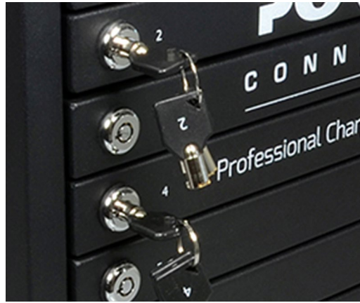
Individual lockable doors