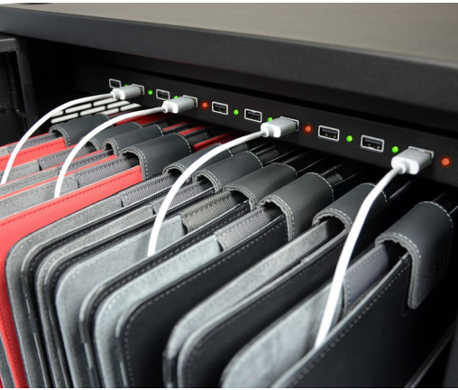
Charge progress LED indicator