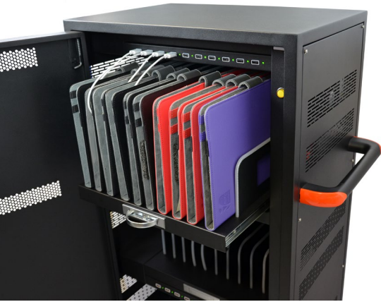
Sliding shelves Étagères coulissantes