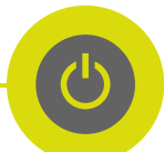
Charge indicator LEDs