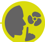
Silent cooling stand