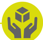
Ergonomic side bar