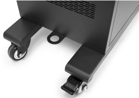
Omnidirectional wheels with brakes + hook for security cable Roues omnidirectionnelles Avec freins + crochet pour câble de sécurité