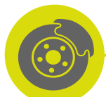
Omni directional wheels + brakes