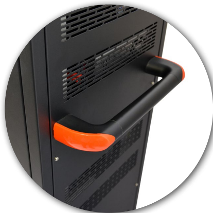
Ergonomic side bar Barres latérales ergonomiques