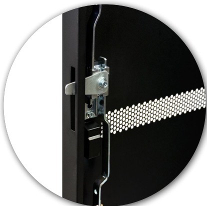
3 points lock Fermeture 3 points