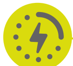
Smart charge 5 volt USB port